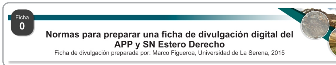
Fig. 1. Detalle del encabezado de la ficha (contiene título, número correlativo y autor de la ficha).

La ficha de divulgación debe tener un título claro (letra Arial tamaño entre 18 y 22 pt). Si el título es muy largo, puede ir en dos párrafos. A la izquierda se indicará un número correlativo. Bajo el título llevará el nombre del autor de la ficha, indicando: "Ficha de divulgación preparada por: Nombre y apellidos, Filiación, año".