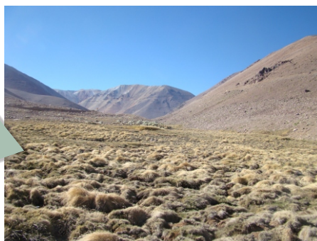
Mapa de Ubicación: sector refugio Samo.