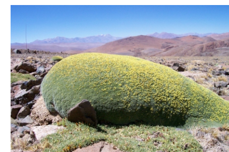
Fig. 2. Llaretas ( Azorella madreporica ) en flor.

El borrador de ficha debe ser entregada en formato digital (.doc o .docx) y las imágenes en formato jpg con buena resolución. El autor puede proponer una diagramación tentativa (en PowerPoint), la que será considerada por la Administración del APP.